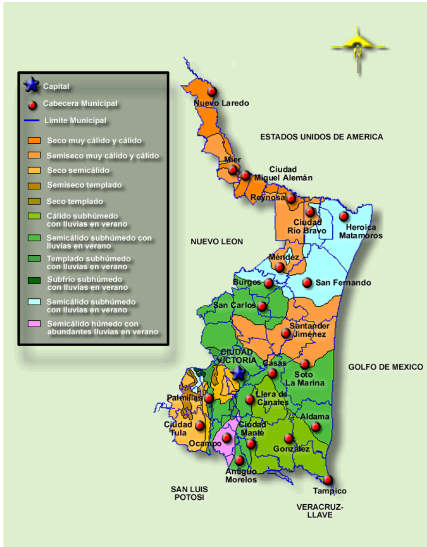
Figura 2. Climas en Tamaulipas.