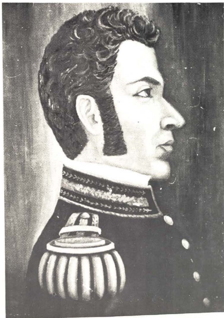
GENERAL FELIPE DE LA GARZA, COMANDANTE GENERAL DE TAMAULIPAS EN 1824.