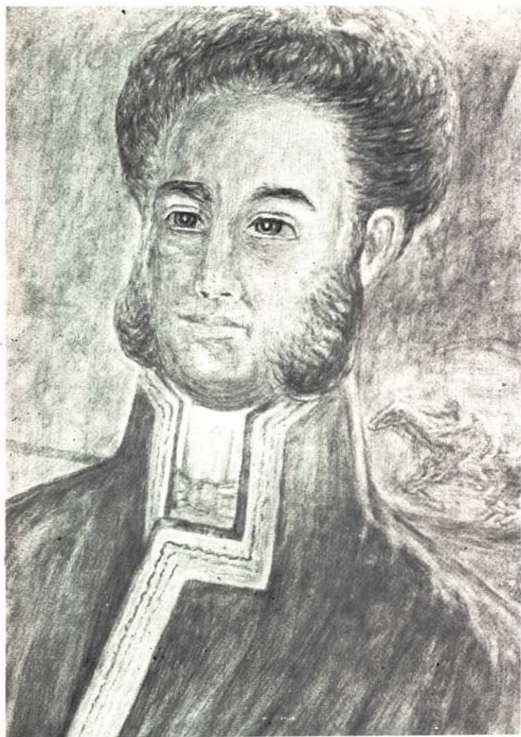
CORONEL JOSE BERNARDO GUTIERREZ DE LARA, GOBERNADOR DE TAMAULIPAS DESIGNADO POR - EL CONGRESO CONSTITUYENTE.